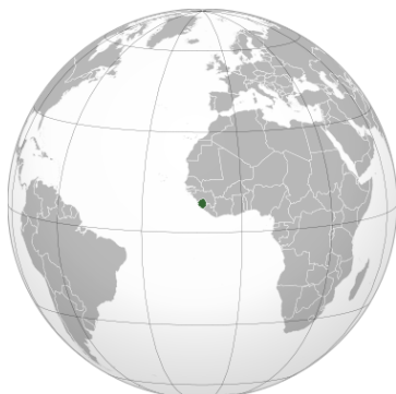
シエラレオネ共和国の位置