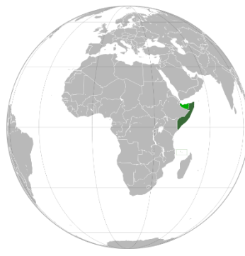
ソマリア連邦共和国の位置