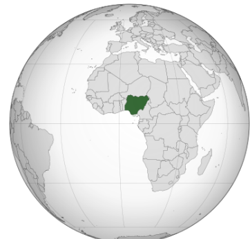
ナイジェリア連邦共和国の位置