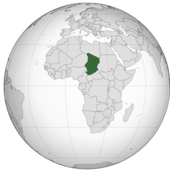
チャド共和国の位置